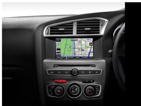
C4 新・標準タッチスクリーン専用カーナビゲーション CNZU510B71