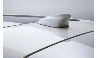
(画像の取付車両は異なります)