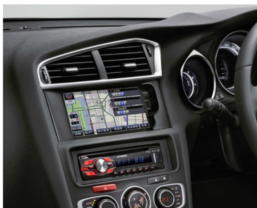
C4 オリジナル カーナビゲーション CNZU500C40